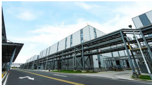
四川天华时代锂电有限公司厂区图