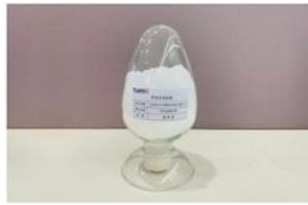
微粉级-单水氢氧化锂