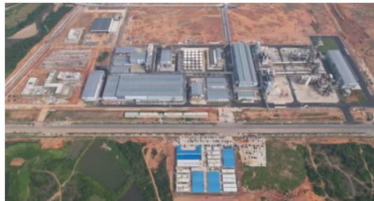
奉新时代项目工地