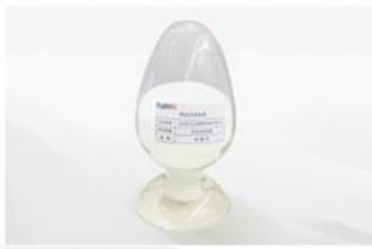
粗颗粒-单水氢氧化锂

近年来，世界主要汽车大国纷纷加强战略谋划、强化政策支持，跨国汽车企业加大研发投入、完善产业布局，新能源汽车已成为全球汽车产业转型发展的主要方向和促进世界经济持续增长的重要引擎。发展新能源汽车是我国从汽车大国迈向汽车强国的必由之路，是应对气候变化、推动绿色发展的战略举措。子公司的电池级氢氧化锂产品、电池级碳酸锂产品主要应用于新能源汽车电池、通讯电子产品电源设备、能源存储等领域。