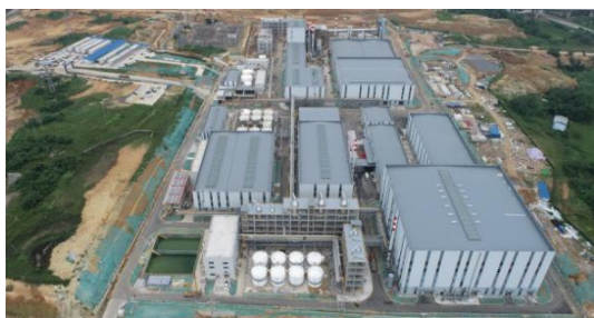
伟能锂电一期年产 2.5 万吨电池级氢氧化锂项目工地