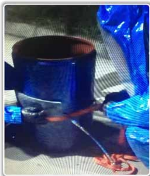
夜间危化品泄露处置演练

每年，各子（分）公司均进行各类事故应急演练，以熟悉应急处置流程、提高员工应急处理能力，检验应急预案适用性，以便及时进行修订。