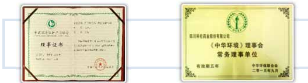
科伦药业为中国环境保护产业协会理事会理事单位