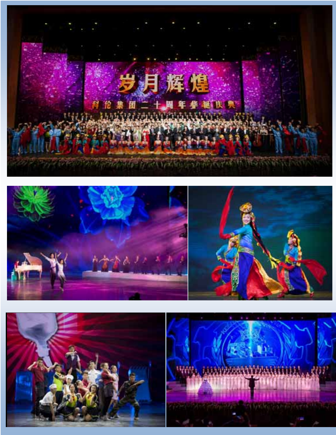
科伦集团二十周年华诞庆典：