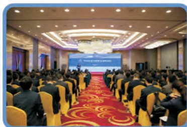
第15届QC成果发表会会议现场