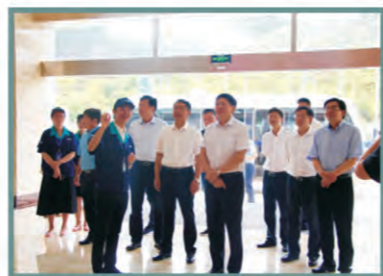
黄建发部长参观浙江国镜厂区