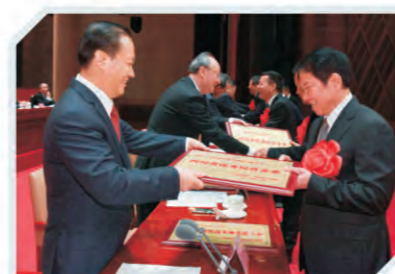
四川省委书记彭清华(左)向刘革新董事长(右)授奖

2018年11月20日上午，四川省民营经济健康发展大会在成都隆重召开，1500位民营企业家、500多名党政领导干部和各方面代表人士汇聚成都主会场、3万多人在各地分会场参会，共商民营经济发展大计。