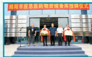
绵阳科伦医贸马明董事长（左二）参加授牌仪式

2018年9月14日，绵阳科伦医贸被设为绵阳市应急医药物资储备库，作为唯一一家被授牌的药品经营企业，将承担绵阳市药品应急物资储备和突发事件药品应急配送工作。绵阳市委、市政府、市食药监局、市卫计委、市应急办等部门领导，绵阳市医药行业各大协会，公司领导和部分干部员工共120余人参加授牌仪式。