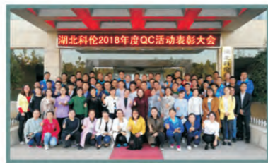
参加表彰的全体代表合影留念