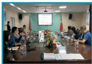
多仓协同配送检查现场

的意见（试行）》（川食药监发〔2018〕3号）文件中积极倡导的创新举措之一。该举措要求符合《四川省药品现代物流系统验收标准》的省内批发企业与其有控股关系的药品批发企业在统一质量控制、统一管理制度、统一信息系统的条件下，多仓协作存储配送药品。绵阳科伦医贸作为科伦医贸的全资子公司，是国家商务部确定的医药物流服务延伸示范企