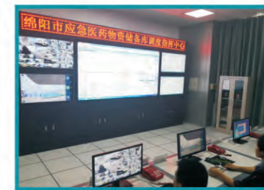
绵阳科伦医贸应急医药物资储备调度指挥中心

马明表示，应急医药物资储备是政府应急管理工作的主要内容之一，事关人民群众的身体健