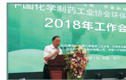
中国化学制药工业协会潘广成会长在大会上致辞

7月25日，与会专家及参会人员还参观考察了川宁生物万吨抗生素中间体项目。大家一致表示，川宁生物在环保方面的努力和創新值得学习和借鉴，希望川宁继续引领促进抗生素行业持续健康发展，大家共同助力中国医药企业产业升级，为增进民众健康福祉而不懈努力。