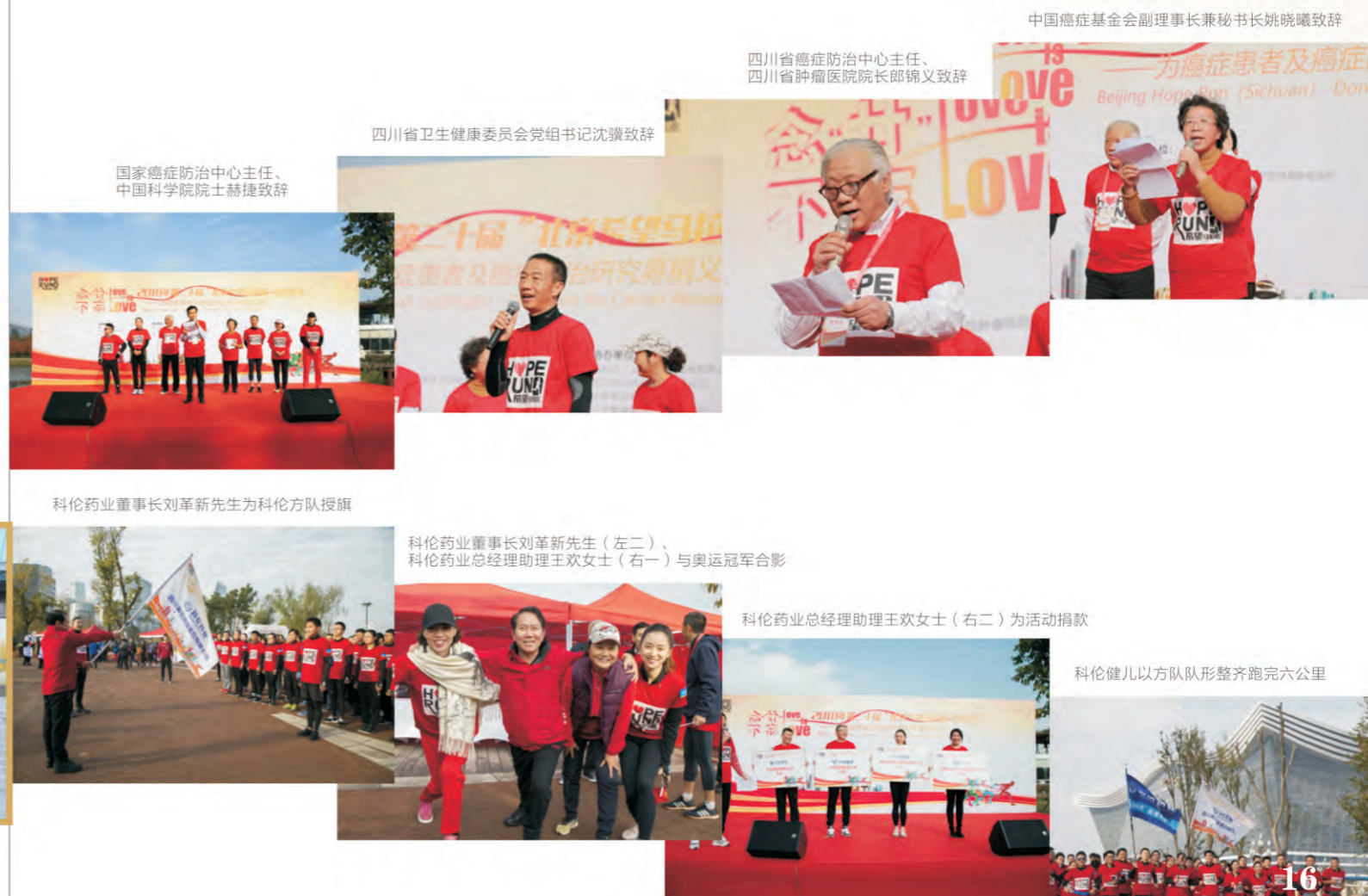
国家癌症防治中心主任、中国科学院院士赫捷致辞