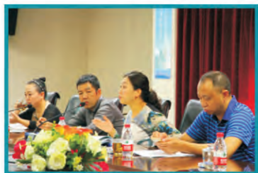
评审组就多仓运营模式等内容进行现场评审检查

2018年9月19至20日，四川科伦医药贸易有限公司（以下简称“科伦医贸”）与四川绵阳科伦医药贸易有限公司（以下简称“绵阳科伦医贸”）多仓联营、协同配送申报项目顺利通过了四川省食品药品监督管理局的现场检查。这是暨《四川省食品药品监督管理局关于鼓励创新推进药品流通行业转型发展的意见（试行）》（川食药监发〔2018〕3号）文件发布之后，四川省内首家通过多仓协同配送现场检查的企业。该项目的顺利通过，标志着科伦医贸在跨区域配送的创新经营模式上迈出了坚实的一步。