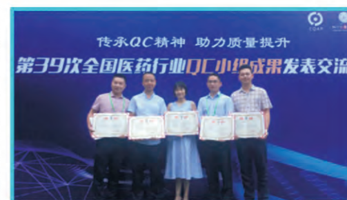
科伦药业五位获奖代表领取获奖证书

长期以来,公司秉持大质量观,始终以严苛的态度对待产品质量,QC活动便是全员参与践行大质量观中不可或缺的途径之一,是全