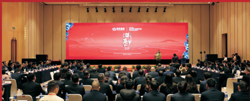
科伦集团第二届群英会现场

“山阻石拦，大江毕竟东流去；雪辱霜欺，梅花依旧向阳开。”2018年是科伦的“创新元年”，注定是不平凡的一年。“三发驱动”新格局和新力量已拉开序幕，科伦的经济运行开始出现由规模数量型向规模效益型转变的拐点，科伦已进入战略反攻阶段。2019年伊始，新的春天正在穿越风雨向我们走来，让我们为科伦高歌，为奋斗者加冕。2019，科伦好运！